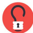
Trézorium alumni 2012 Centrale Lille ITEEM Co-fondateur

“Donnons à nos enfants les clefs du monde de demain”, Trézorium les enfants et grands enfant à cultiver leur créativité et leur émancipation par le "faire" et le bon usage des derniers outils numériques. en savoir plus